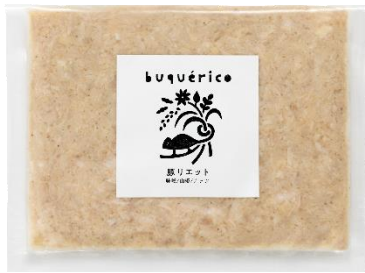
豚リエット 味噌/山椒/ナッツ

「豚リエット」は、味噌で調味した豚のリエットに山椒とカシューナッツを加え、ほどよい味噌の塩味がきいたさっぱりとした味わいが特長です。「牛コンビーフ」は、国産牛のおいしさはそのままに、味噌のコクとクリームチーズの酸味、ゆずの香りをきかせ、肉のしつこさを感じさせないおつまみにぴったりなコンビーフに仕上げました。和・洋・発酵のマリアージュが楽しめる味噌香るおつまみです。バケツはもちろんのこと、茹でたじゃがいもや温野菜を添えて、ゆったりとした心地よい晩酌の時間をお楽しみください。