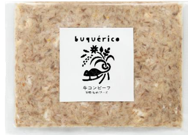
牛コンビーフ 味噌/柚子/チーズ