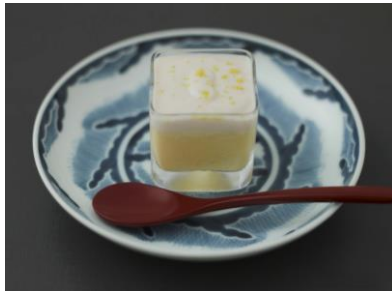
11 月季節のコース お凌ぎ

80 年余り、日本の伝統食品である味噌づくりに邁進してきたひかり味噌が、発酵と熟成を新たな形でお届けするために開業した日本料理レストランです。味噌の由来とされる「鼓」を店名に掲げ、和食に革新を融合させた日本料理を通して、発酵と熟成の魅力を発信します。