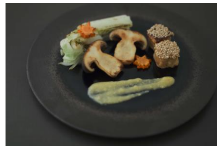
11 月ビーガンコース メイン

当店名物の白味噌とクリームチーズの茶碗蒸し。今月は酒蒸し塩こうじで味を調えうらごしした雲子を合わせて。