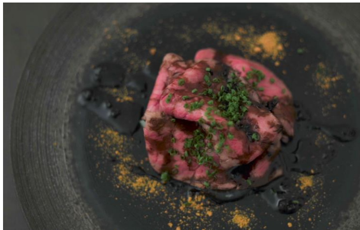
和牛ローストビーフ バルサミコと大徳寺納豆ソース 味噌パウダー