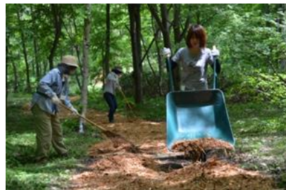
右)土壌の保護のため、森の散策道に間伐材のチップを敷き詰めている様子。