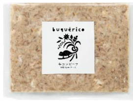
牛コンビーフ 味噌/柚子/チーズ