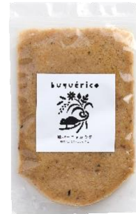
鯖バーニャカウダ 味噌/玉ねぎ/しよつる