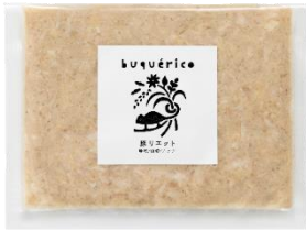
豚リエット 味噌/山椒/ナッツ

バケツはもちろんのこと、茹でたじゃがいもや温野菜を添えて、ゆったりとした心地よい晩酌の時間をお楽しみください。