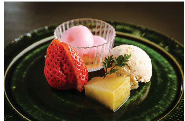
[甘味] 落味噌アイス 桜白玉 「銀座鼓特選 禅」 甘蜜 王林ワイン煮 季節のフルーツ