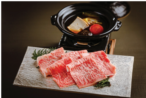
[鍋物] 鹿児島黒牛サーロイン味噌すき焼き 味噌だまりを使用した割り下 野菜色々