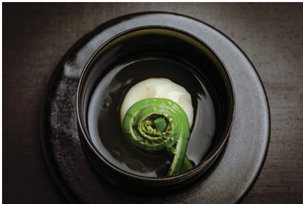
[先付] 百合根饅頭 芝海老 味噌もろみ ごごみ 「銀座鼓特選 禅」の上澄み餡

3月のコース内容をご案内いたします。春の訪れを感じさせる旬の食材をふんだんに使用しました。有機白味噌の「銀座鼓特選 禅」の上澄み出汁を餡にさせていただく百合根饅頭、春の野山を思わせる彩の八寸や、醤油を使わず味噌だまりの割り下でいただく KUKI スタイルの味噌すき焼きなど、当店では味わえない逸品を提供いたします。