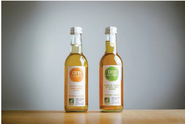
アラン・ミリアの無添加果汁ドリンク