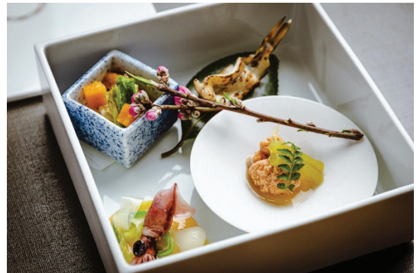
[八寸] 蛍烏賊 のびる 酢味噌掛け / 鯛の子旨煮 木の芽 / 落西京漬け / うるい土佐和え / わかさぎ姿焼き