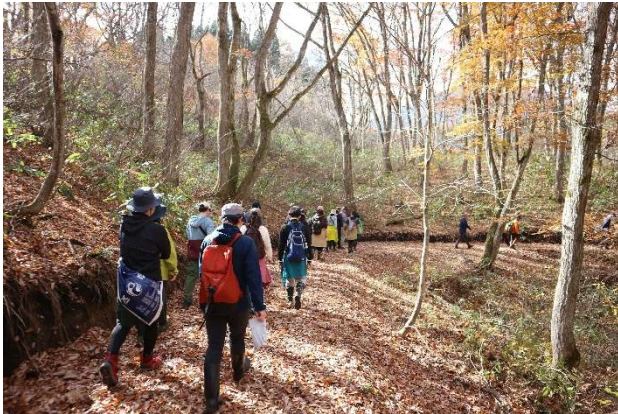
南エリアを歩く様子

アフアの森財団の指導の元、同財団が伐採をした木々をまとめる作業や、指定の植物を伐採する作業に従事いたしました。第1回の本セミナー後にも同財団による手入れが施されており、明るさや見晴らしの違いなどの森の変化に驚嘆し、再生活動の重要性を実感いたしました。1時間ほどの作業後は、当社の新商品『THE ORGANIC 有機米麴』とアフアの森で採取されたきのこをたっぷり使ったきのこ汁と、地元の旬の食材をふんだんに使用したマクロビオティック「癒しの森弁当」を、自然の恵みに感謝しながらいただきました。